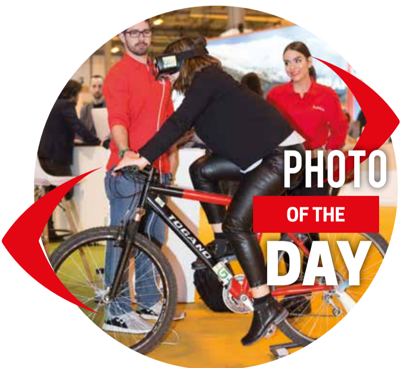
PHOTO OF THE DAY